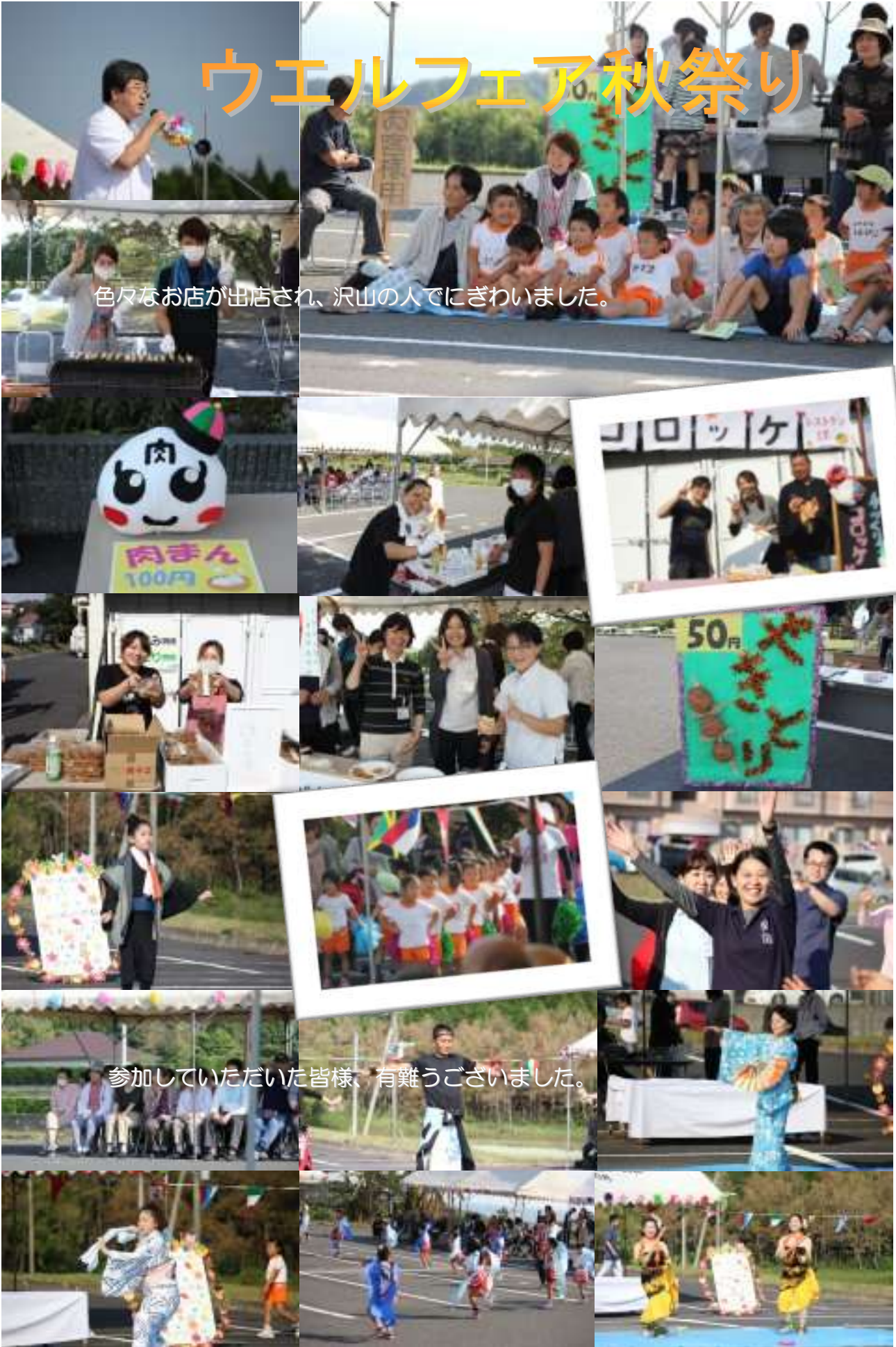
色々なお店が出店され、沢山の人でにぎわいました。