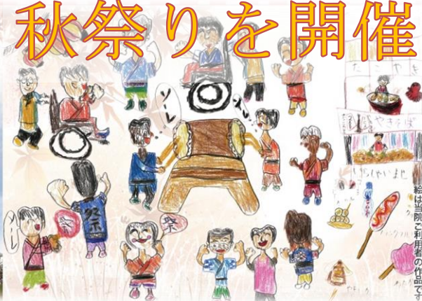
絵は当院ご利用者の作品です

10月28日(土)に秋祭りを開催しました。当日は食べ物や飲み物、ヨーヨーつりなど様々な出店がありました。プログラムでは、火の神太鼓、海の風こども園、別府児童クラブ、棒踊り、太鼓踊りの催し物がありました。